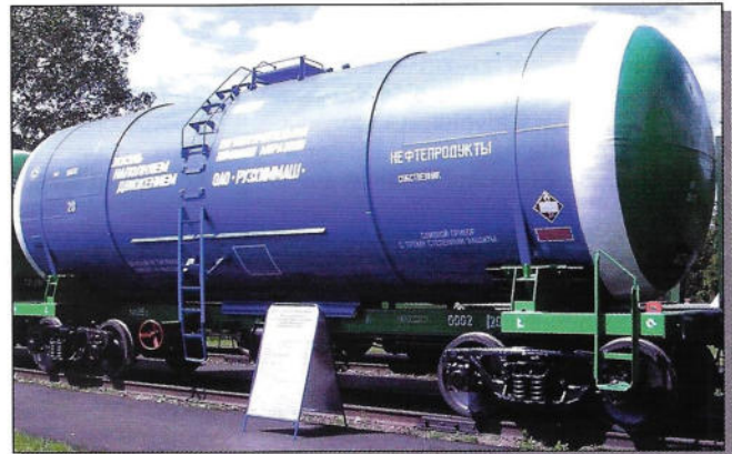
Рис. 4. Вагон-цистерна модели 15-1219 для перевозки легкой нефти

На четвертом этапе разработаны предложения по модельному ряду новых вагонов-цистерн. Для улучшения технико-экономических показателей и полного использования допускаемой нагрузки на ось было рекомендовано внедрить групповую специализацию вагонов-цистерн: