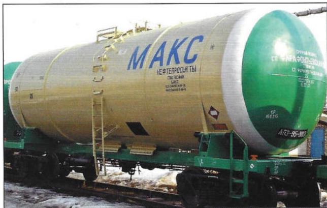
Рис. 3. Вагон-цистерна модели 15-1221 для перевозки авиационного топлива

Применение дифференцированного способа налива груза позволит увеличить экономический эффект на 8 — 12%. Использование безрамного ва-